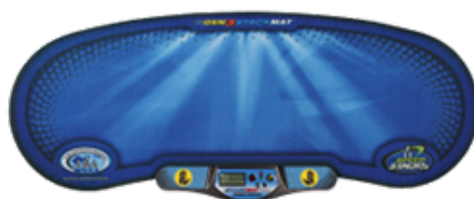
StackMat Pro Timer en Generation 3 Mat (wedstrijdmat en -chronometer)

De StackMat Pro Timer (chronometer) is geactiveerd wanneer beide handen op de contactoppervlakken ( touch pads ) geplaatst zijn. Hierdoor gaan het rode en groene lampje oplichten. Dit betekent dat de chrono klaar is om de tijd te meten. De chrono begint te lopen zodra de stapelaar een of beide handen opheft van de contactoppervlakken. De tijdmeting stopt wanneer de stapelaar beide handen weer op de contactoppervlakken plaatst.